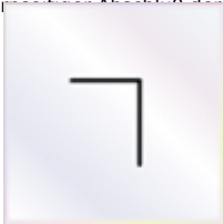
6 Stück Silikon

- als sturmsichere Abschluss für Rahmenprofile Zur Sicherung der Stegplatte gegen Rutschen