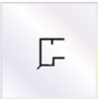
5 Stück x 0,98 m Abrutschwinkel

- einschl. des erforderlichen Tape - Bandes zum Verschließen der Stirnseite der Stegplatte. Die Tape - Bänder werden von uns gleich an die Stirnseite der Platte verklebt.