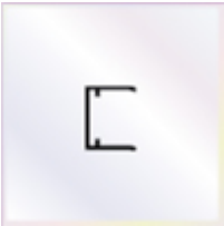
5 Stück x 0,98 m Alu - U - Profil mit Tropfkante

- einschl. des erforderlichen Tape - Bandes zum Verschließen der Stirnseite der Stegplatte. Die Tape - Bänder werden von uns gleich an die Stirnseite der Platte verklebt.