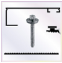
2 Stück a 3500 mm Alu - U - Profil

- einschl. des erforderlichen Tape - Bandes zum Verschließen der Stirnseite der Stegplatte. Die Tape - Bänder werden von uns gleich an die Stirnseite der Platte verklebt.