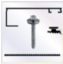
2 Stück a 4000 mm Alu - U - Profil

- einschl. des erforderlichen Tape - Bandes zum Verschließen der Stirnseite der Stegplatte. Die Tape - Bänder werden von uns gleich an die Stirnseite der Platte verklebt.