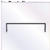
10 Stück a 4000 mm Wandanschlußprofil mit Aufkantung zum Versiegeln und Lippendichtung

OPTIONAL Alu - Abdeckprofil als passendes Klemmprofil für vorgenan. Verbindungsprofile Ausführung: weiß / braun / silber lackiert - Bitte die gewünschte Farbe in Bestellnummer oder Bemerkung angeben.