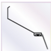
2 Stück a 4500 mm